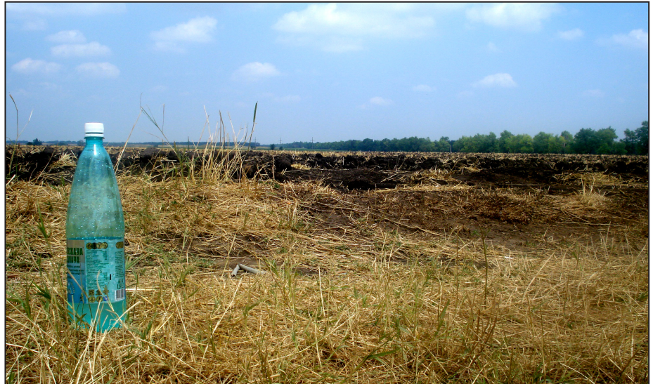
Степь да степь... и местная минералка!

Подъем на базе наступал в семь. К 7:15 необходимо было поспеть на завтрак, который, как правило, проходил в тишине и полудреме. После быстрых сборов все грузились в транспорт и, прыгая по кочкам, к 9